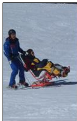
Fauteuil handi-ski toute la saison